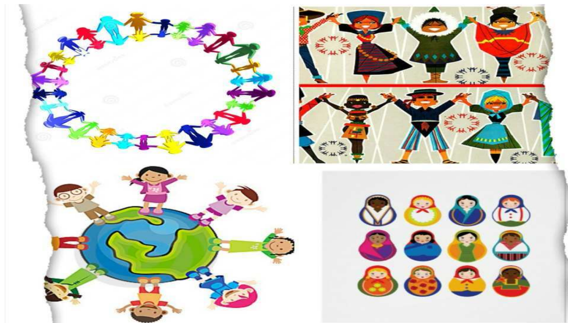
„ЕДЕН СВЕТ, А ТОЛКУ МНОГУ БОИ“